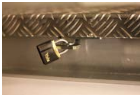
Låseanordning for hengselås er standard.