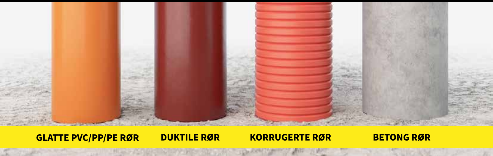
GLATTE PVC/PP/PE RØR